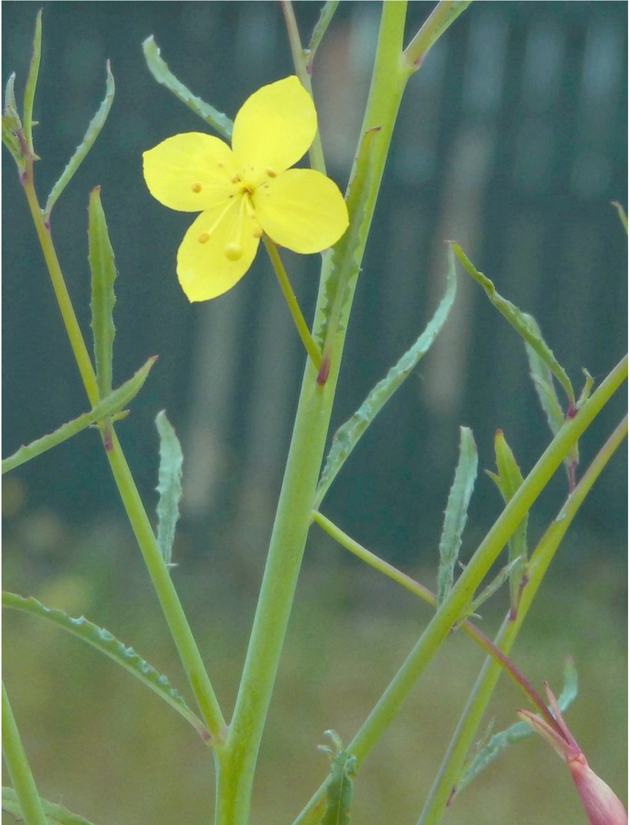
Photo n° 26. Camissonia campestris (Greene) P. H. Raven – 30 mars 2024