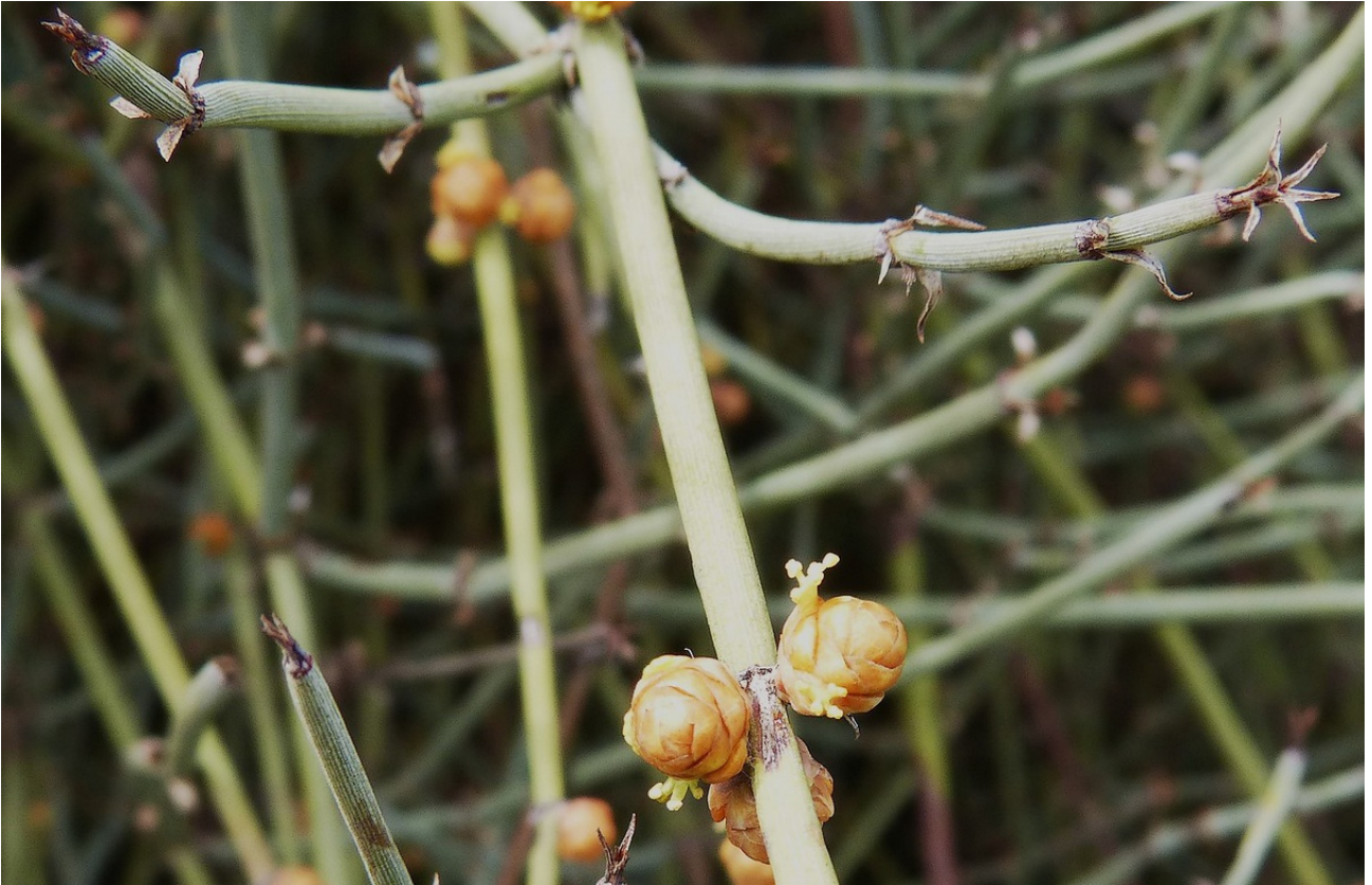
Photo n° 40. Ephedra californica S. Watson – 30 mars 2024