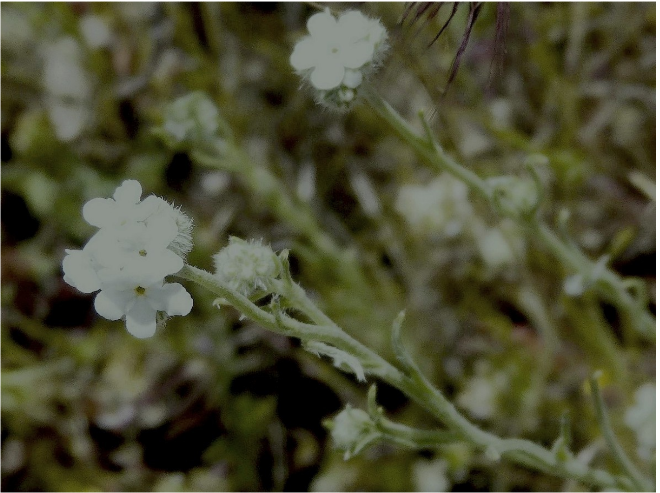
Photo n° 34. Cryptantha sp.s - (mauvaise) - 30 mars 2024