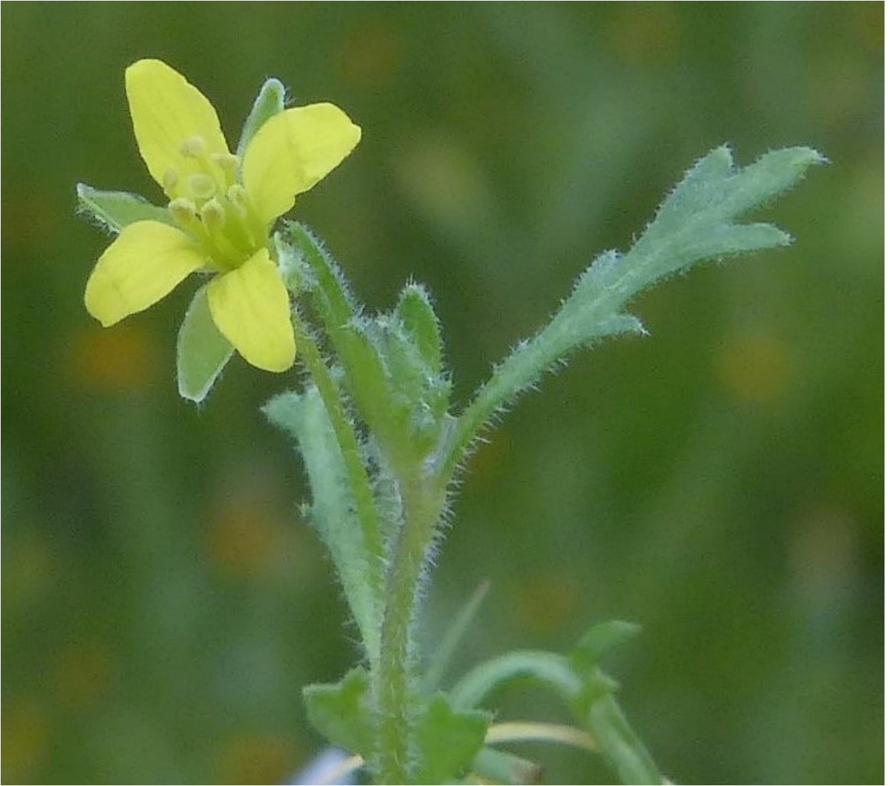
Photo n° 94. Tropidocarpum gracile Hook. – 30 mars 2024