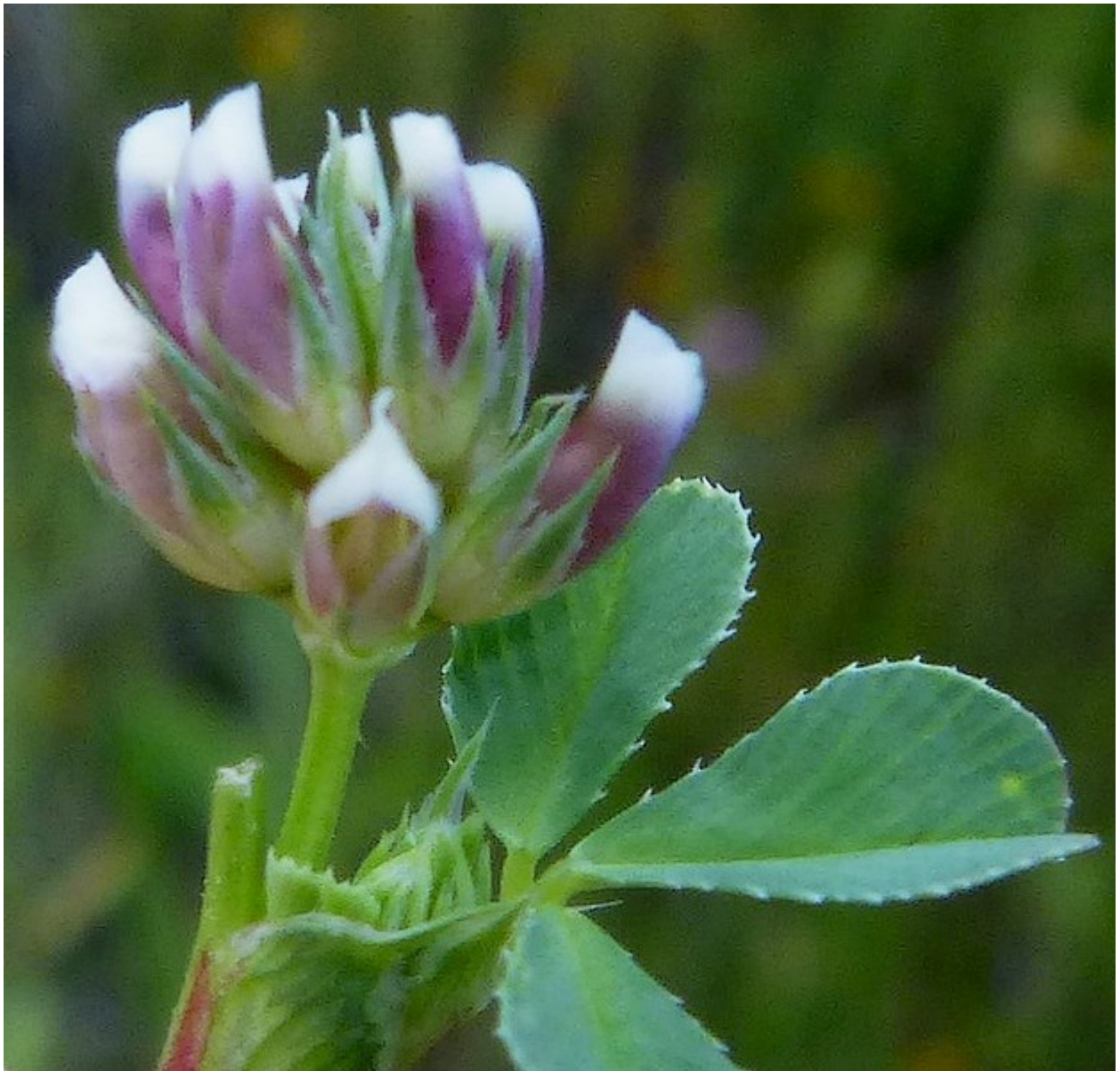
Photo n° 92. Trifolium gracilentum Torr. & A. Gray – 30 mars 2024