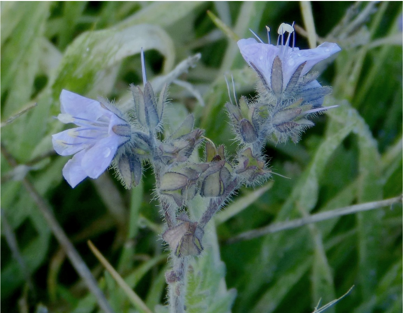
Photo n° 78. Phacelia douglasii (Benth.) Torr. - 30 mars 2024