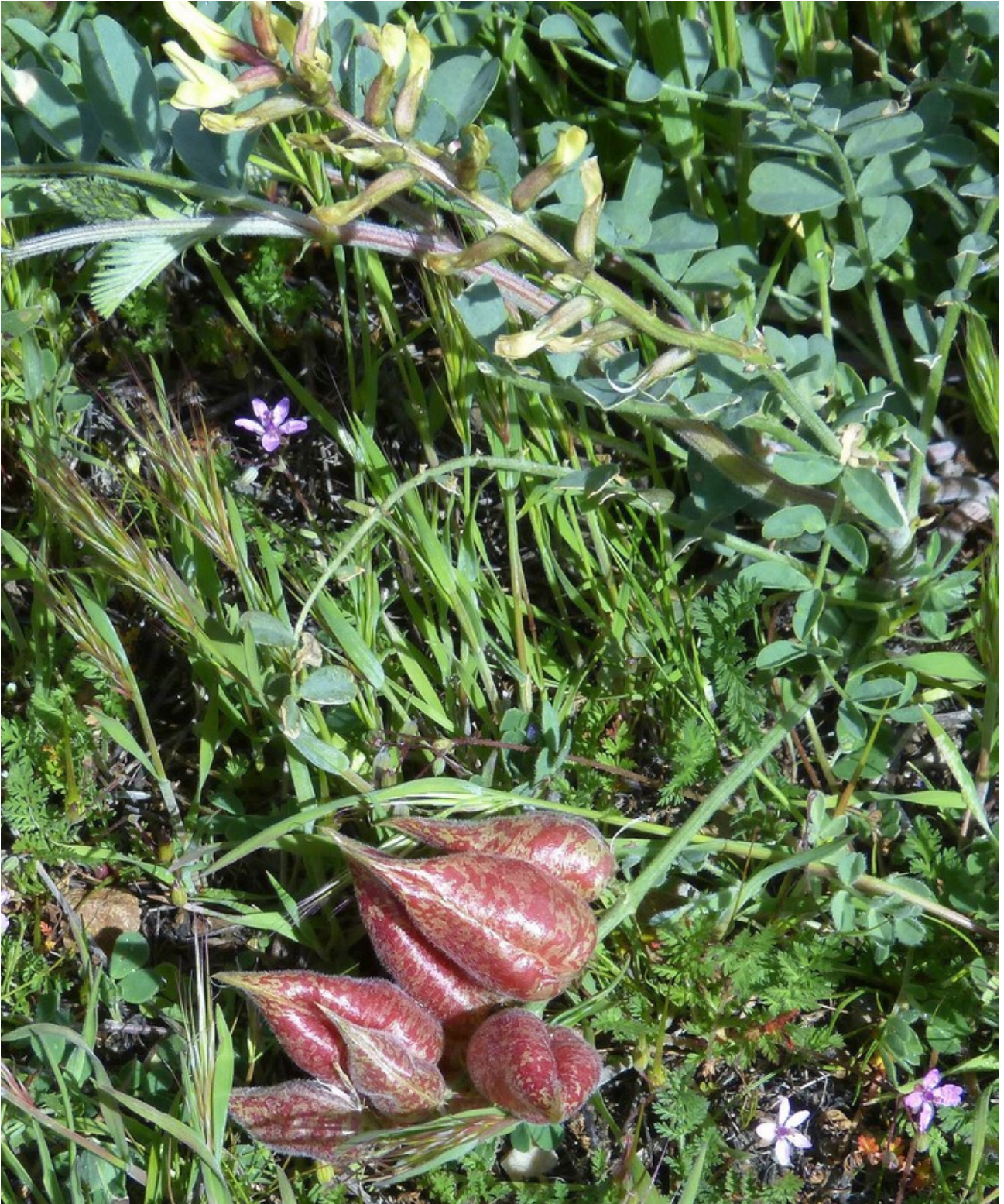
Photo n° 18. Astragalus lentiginosus Douglass – 30 mars 2024