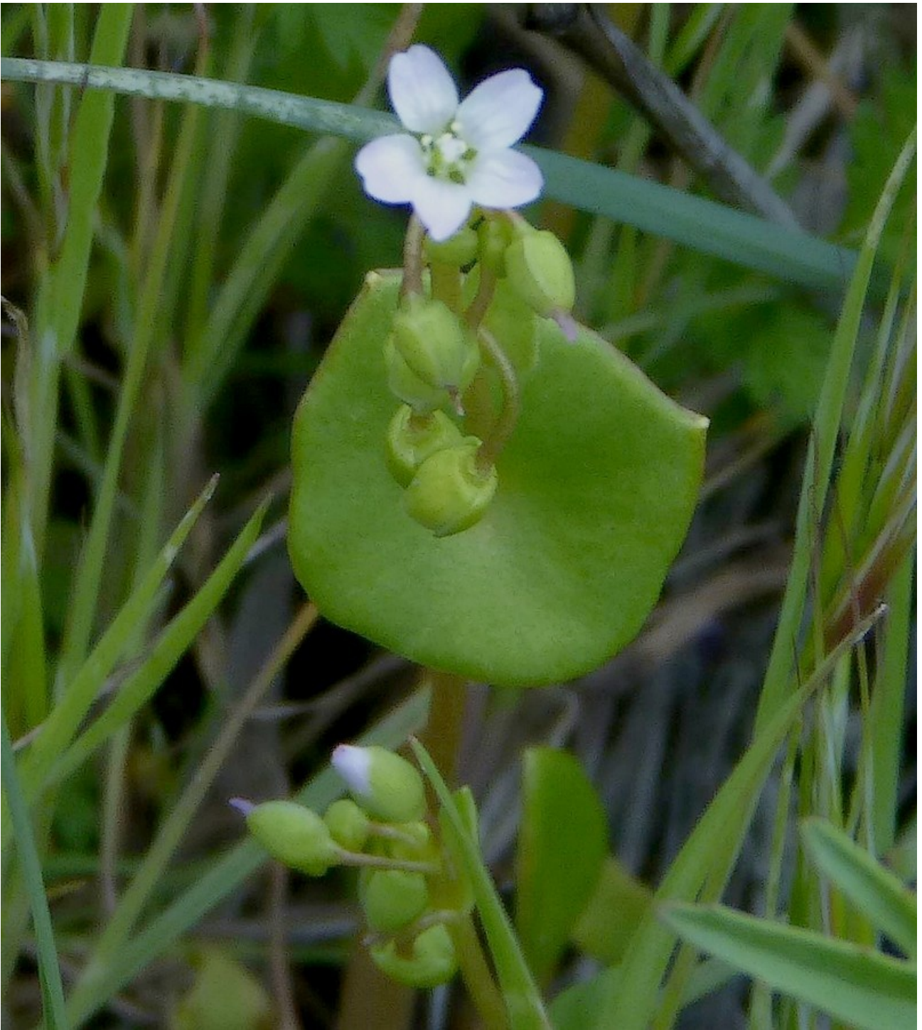
Photo n° 32. Claytonia perfoliata Donn ex Willd. – 30 mars 2024