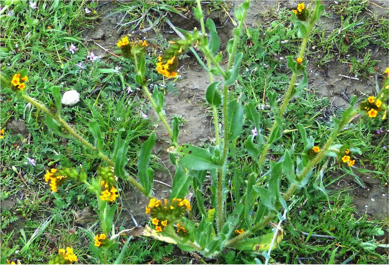
Photo n° 12. Amsinckia furcata Suksd. – 30 mars 2024