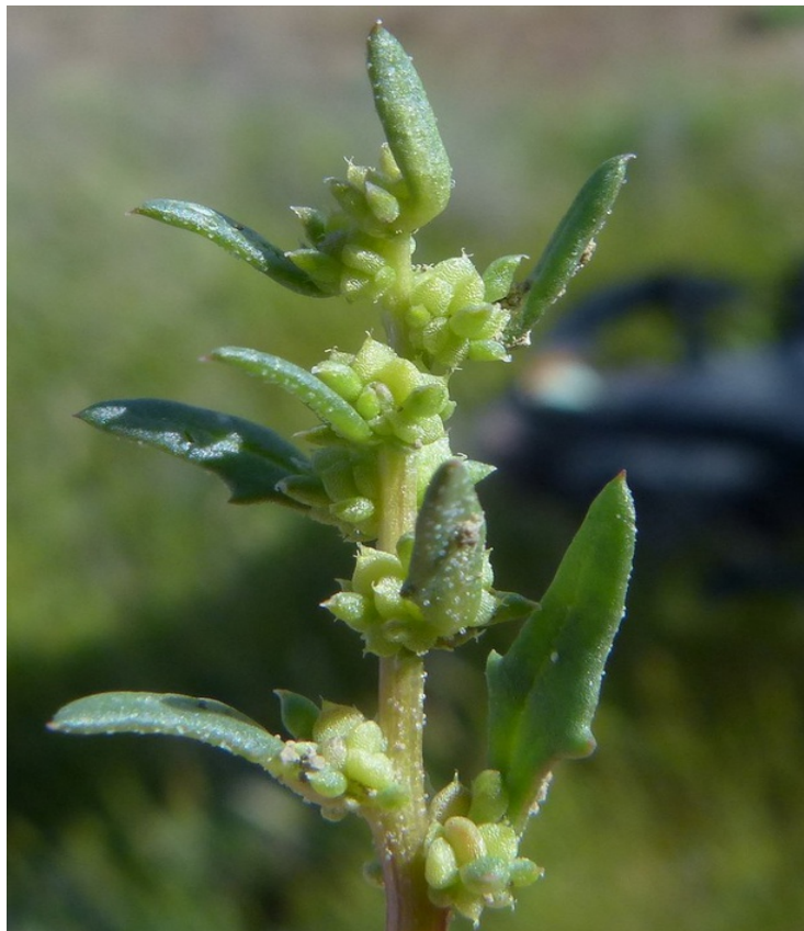
Photo n° 22. Atriplex coronata S. Watson – 30 mars 2024