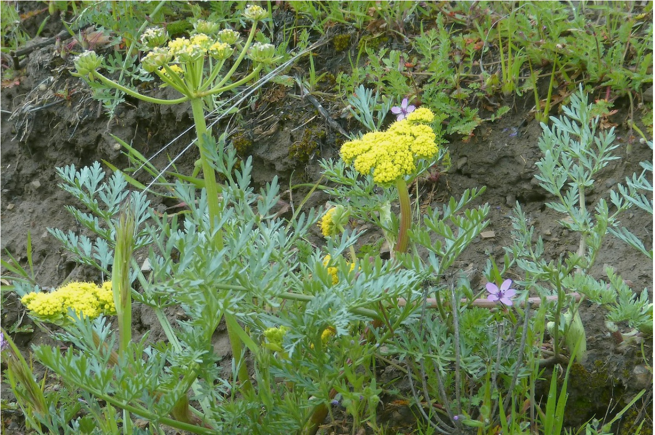
Photo n° 64. Lomatium utriculatum (Nutt. ex Torr. & A. Gray) J. M. Coult. & Rose – 30 mars 2024

Photo n° xx. Leptosyne calliopsidea (DC.) A. Gray – Pas de photo DG