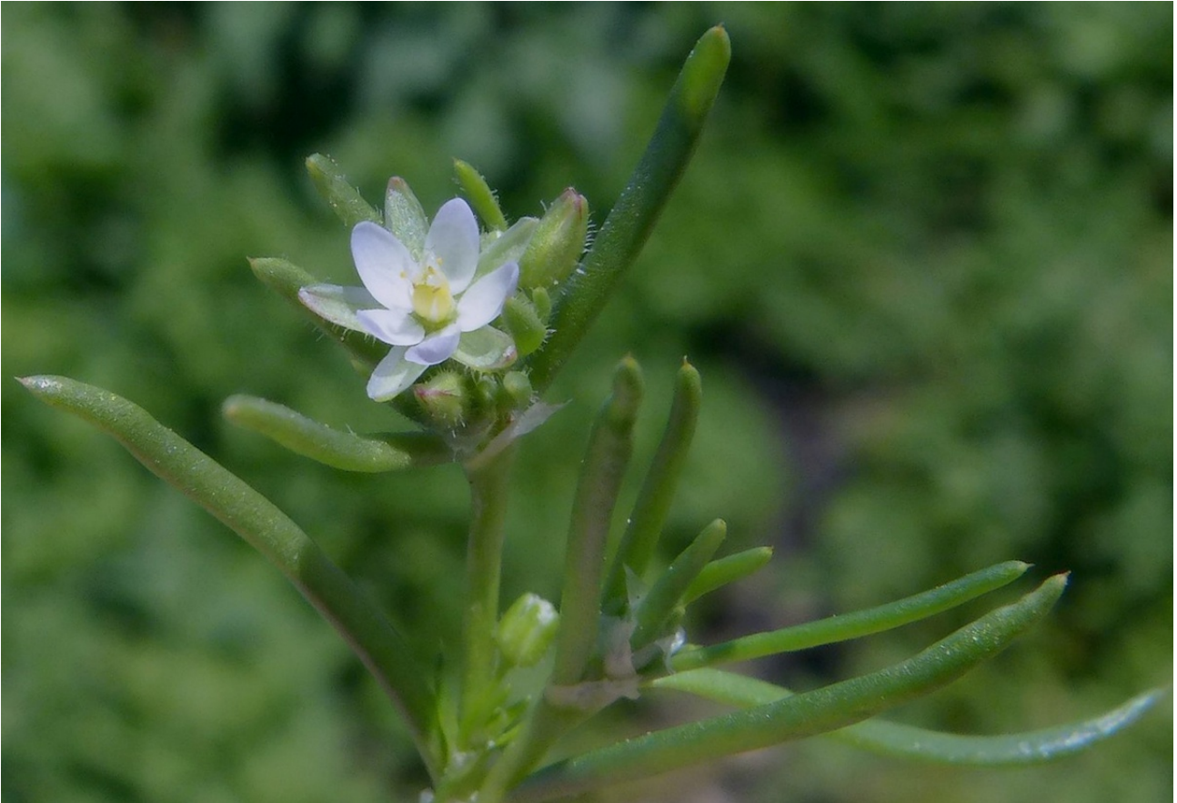
Photo n° 86. Spergularia marina (L.) Besser – 30 mars 2024, © D. Gaudefroy

Photo n° xx. Streptanthus lasiophyllus (Hook. et Arn.) Hoover – Pas de photo DG