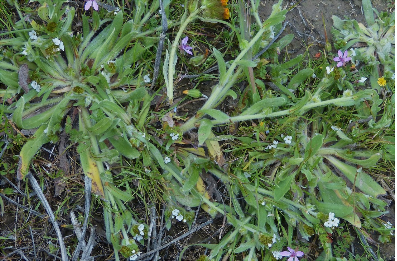
Photo n° 74. Pectocarya linearis (Ruiz & Pav.) – 30 mars 2024