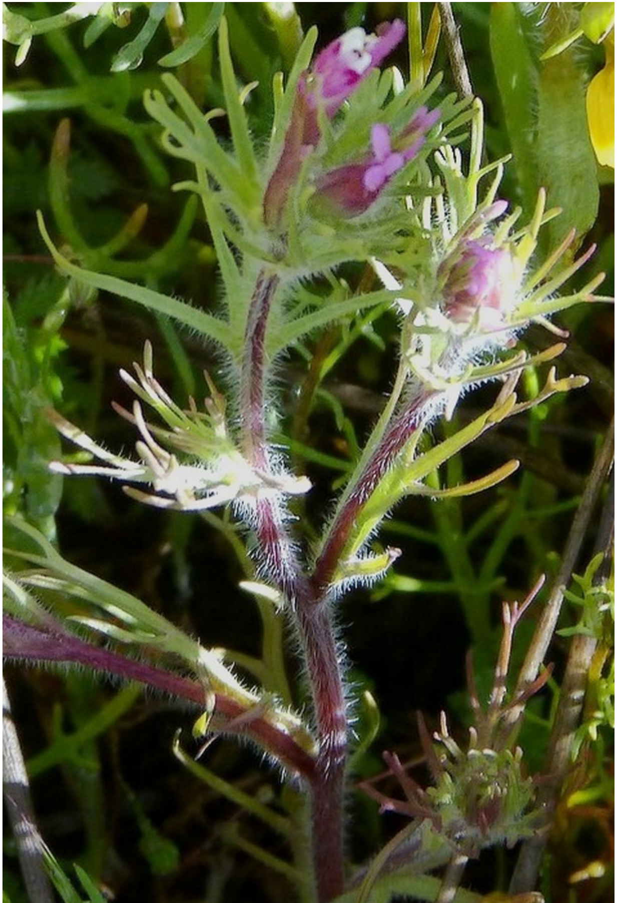
Photo n° 28. Castilleja attenuata (A. Gray) T. I. Chuang et Heckard - 30 mars 2024