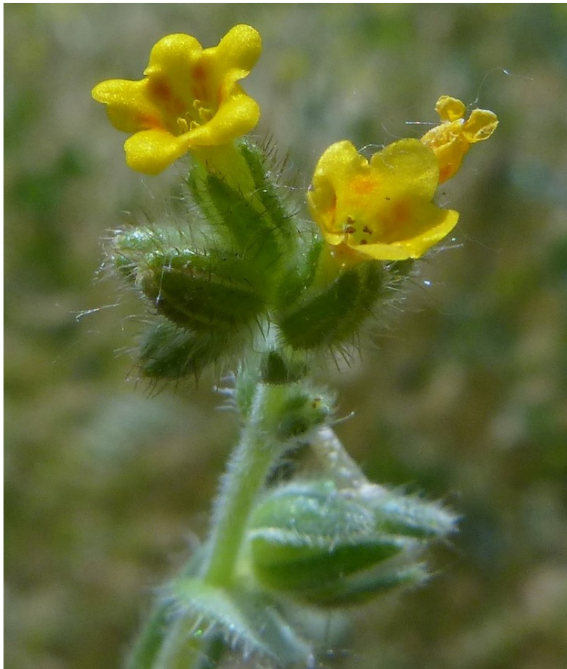
Photo n° 14. Amsinckia menziesii (Lehm.) A. Nelson & J. F. Macbr. – 30 mars 2024