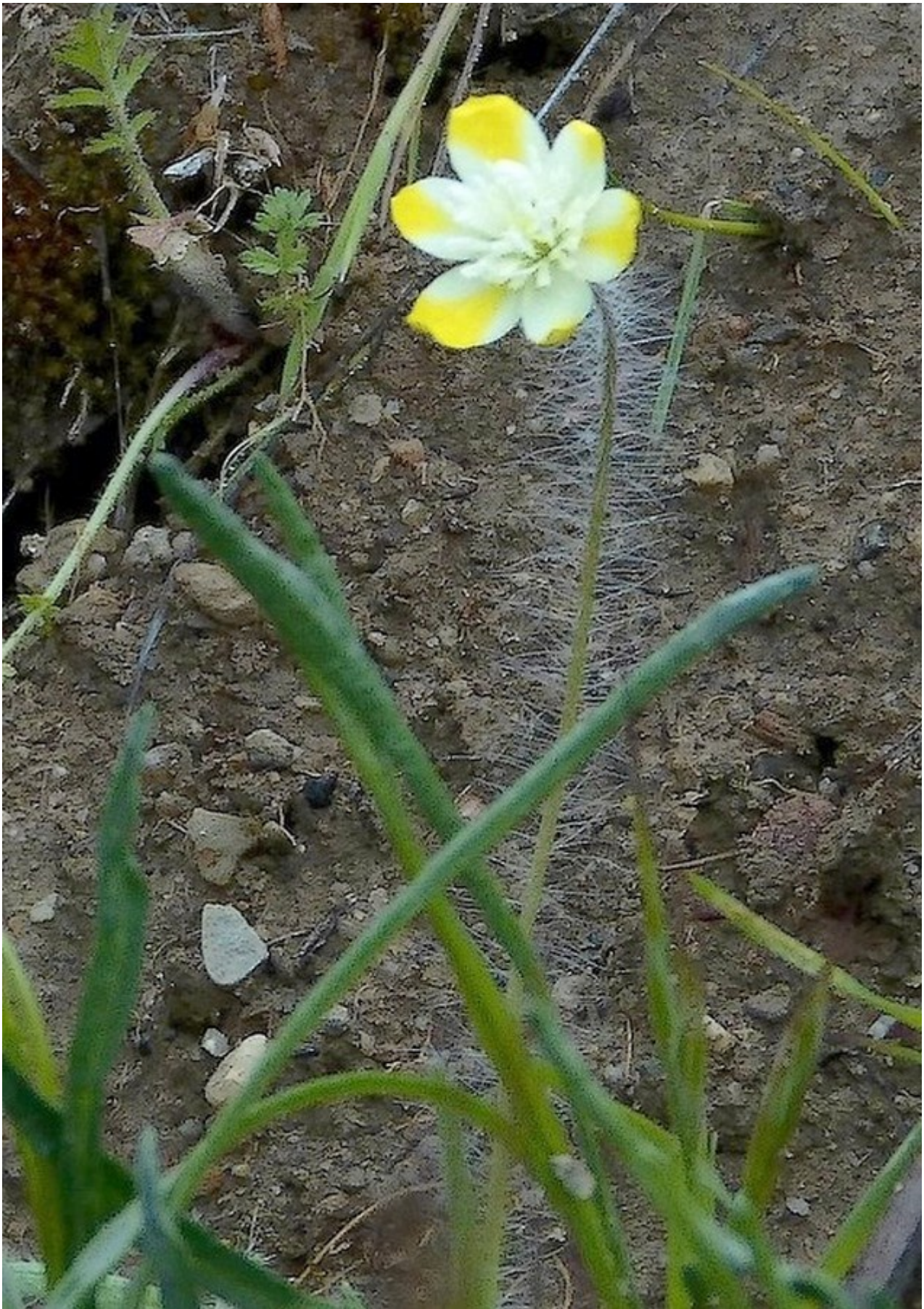
Photo n° 80. Platystemon californicus Benth. – 30 mars 2024