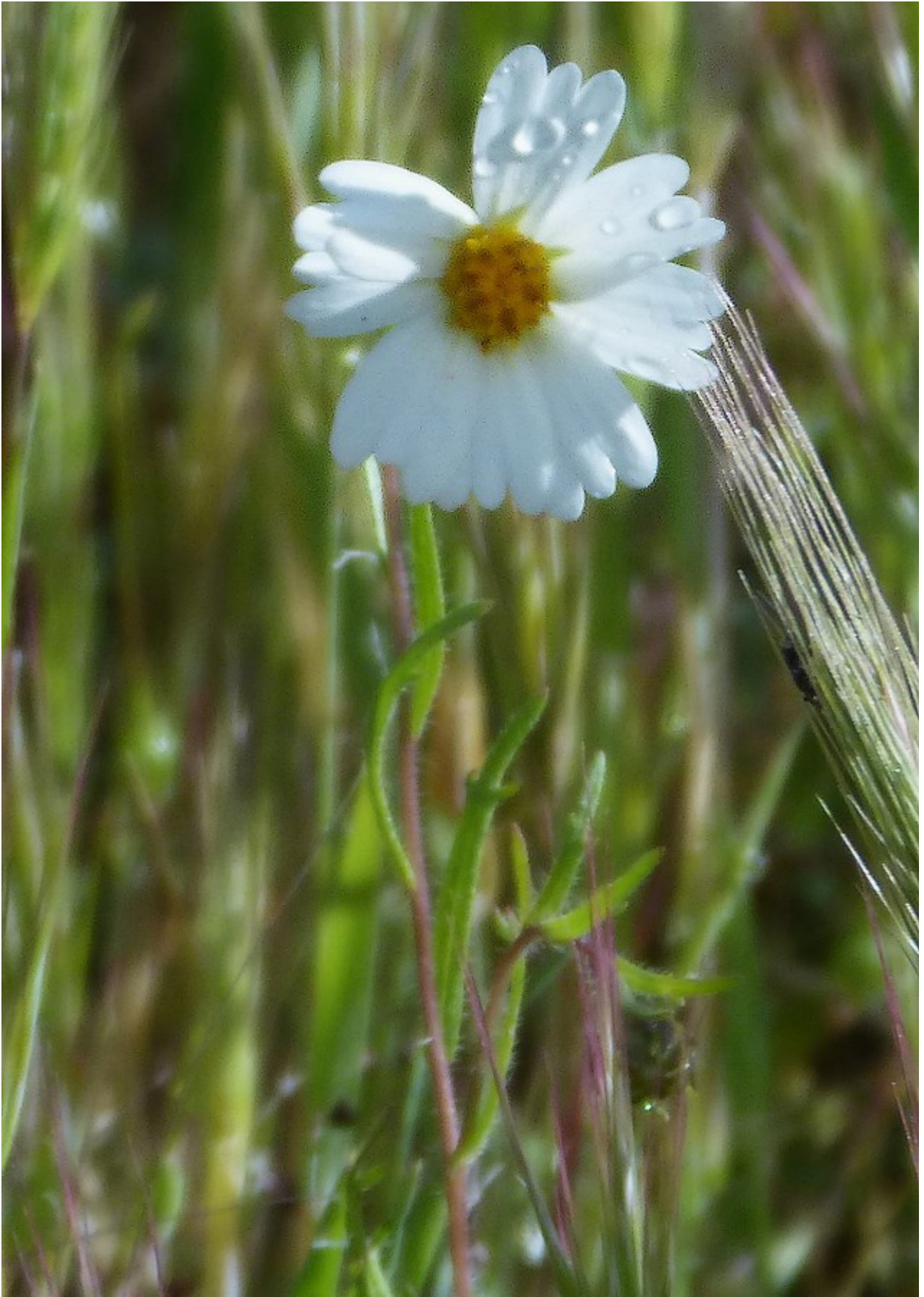
Photo n° 54 Layia heterotricha (DC.) Crochet. et Arn. – 30 mars 2024