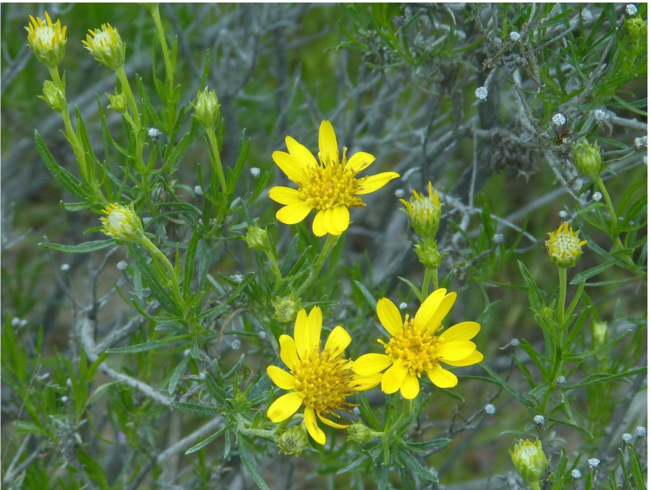
Photo n°42. Ericameria linearifolia (DC.) Urbatsch et Wussow – 30 mars 2024, © D. Gaodefroy