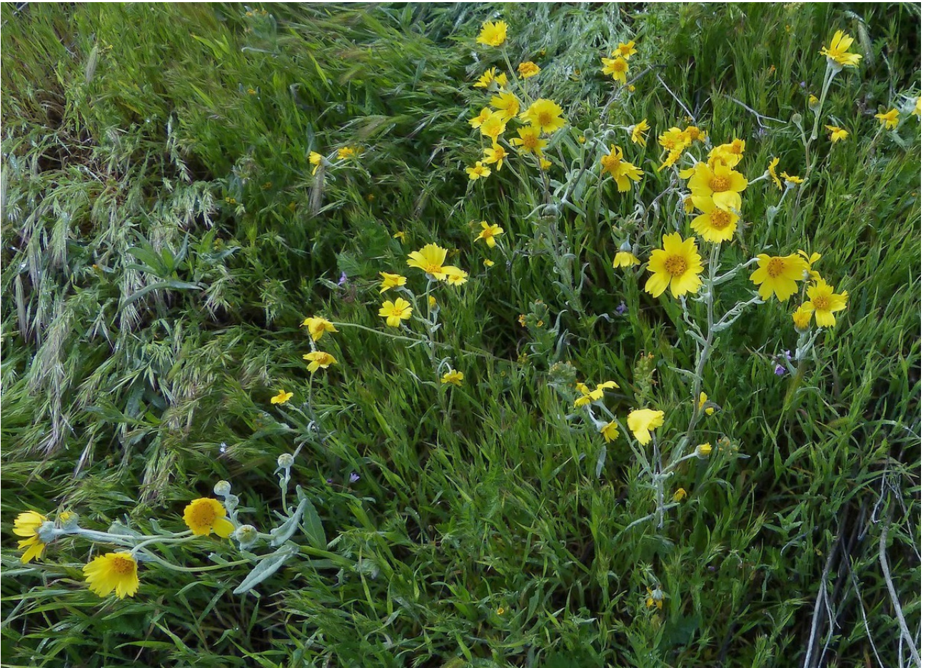
Photo n° 72. Monolopia lanceolata Nutt. – 30 mars 2024