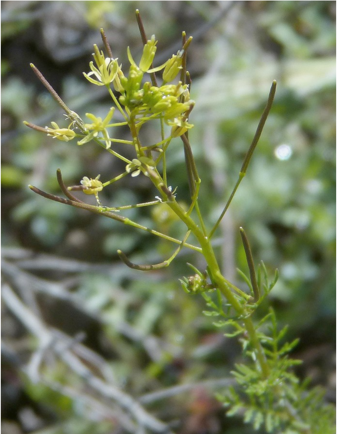
Photo n° 36. Descurainia pinnata (Walter) Britton – 30 mars 2024