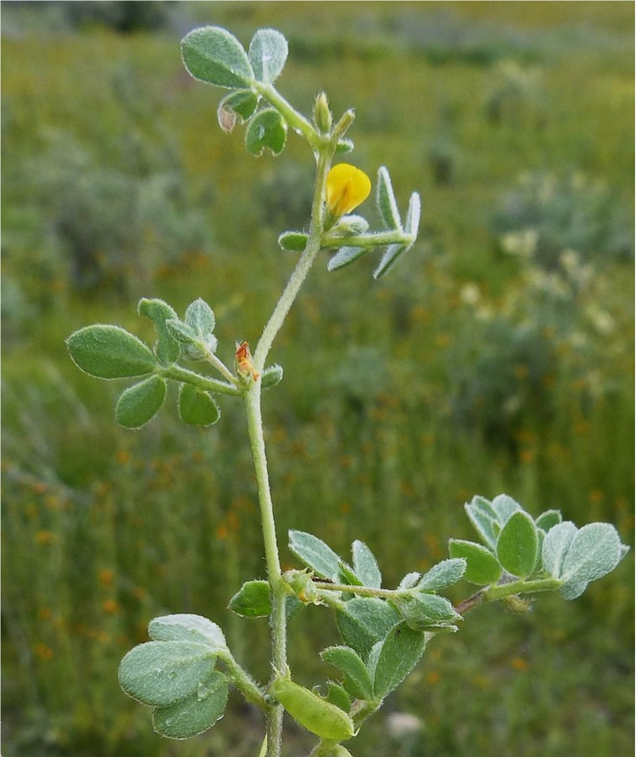
Photo n° 10. Acmispon wrangelianus (Fisch. & C. A. Mey.) D. D. Sokoloffs – 30 mars 2024