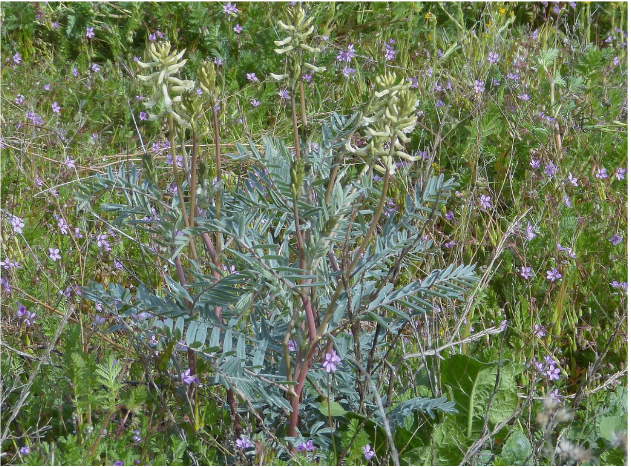
Photo n° 20. Astragalus oxyphysus A. Gray – 30 mars 2024, © D. Gaudefroy