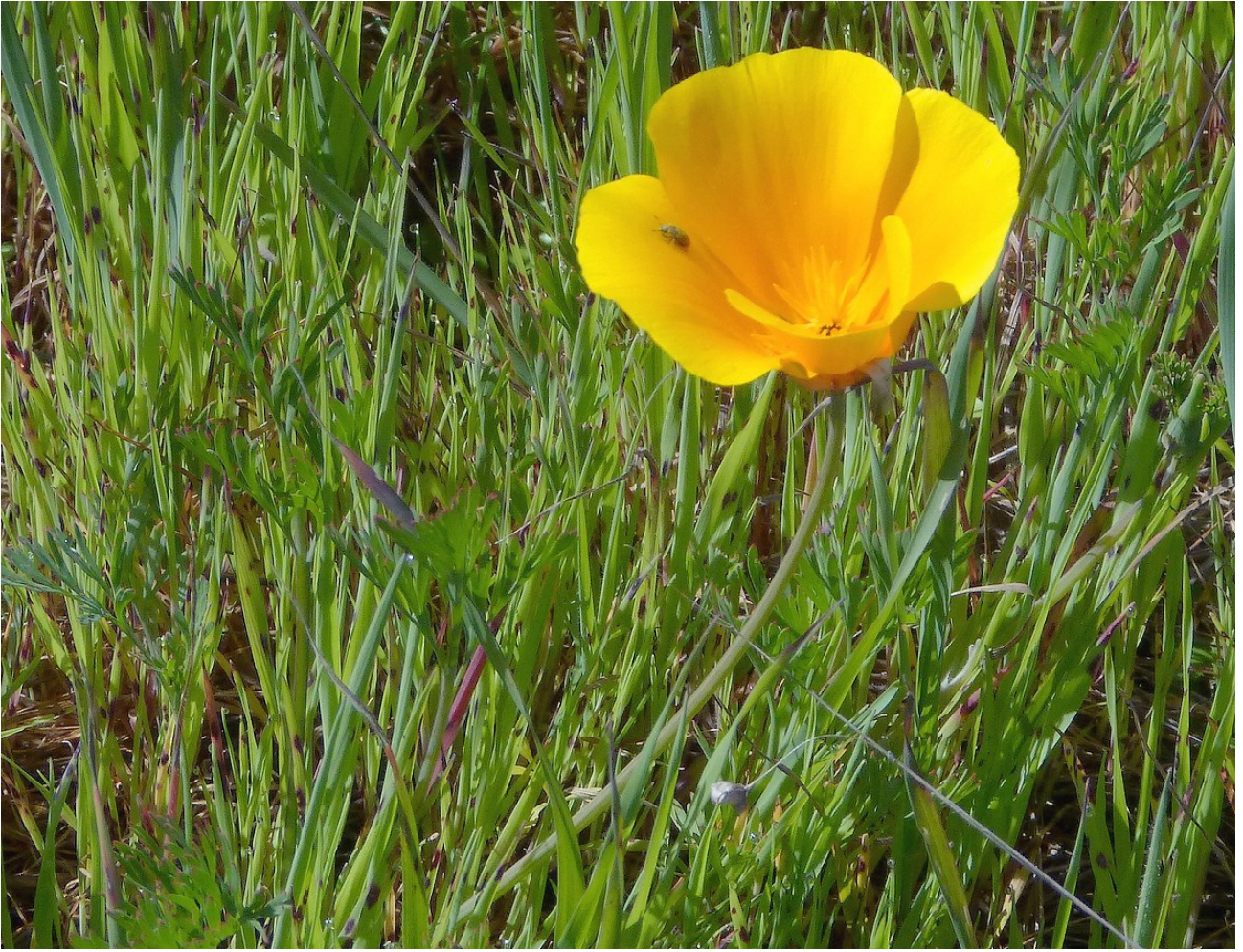
Photo n° 44. Eschscholzia californica Cham. – 30 mars 2024