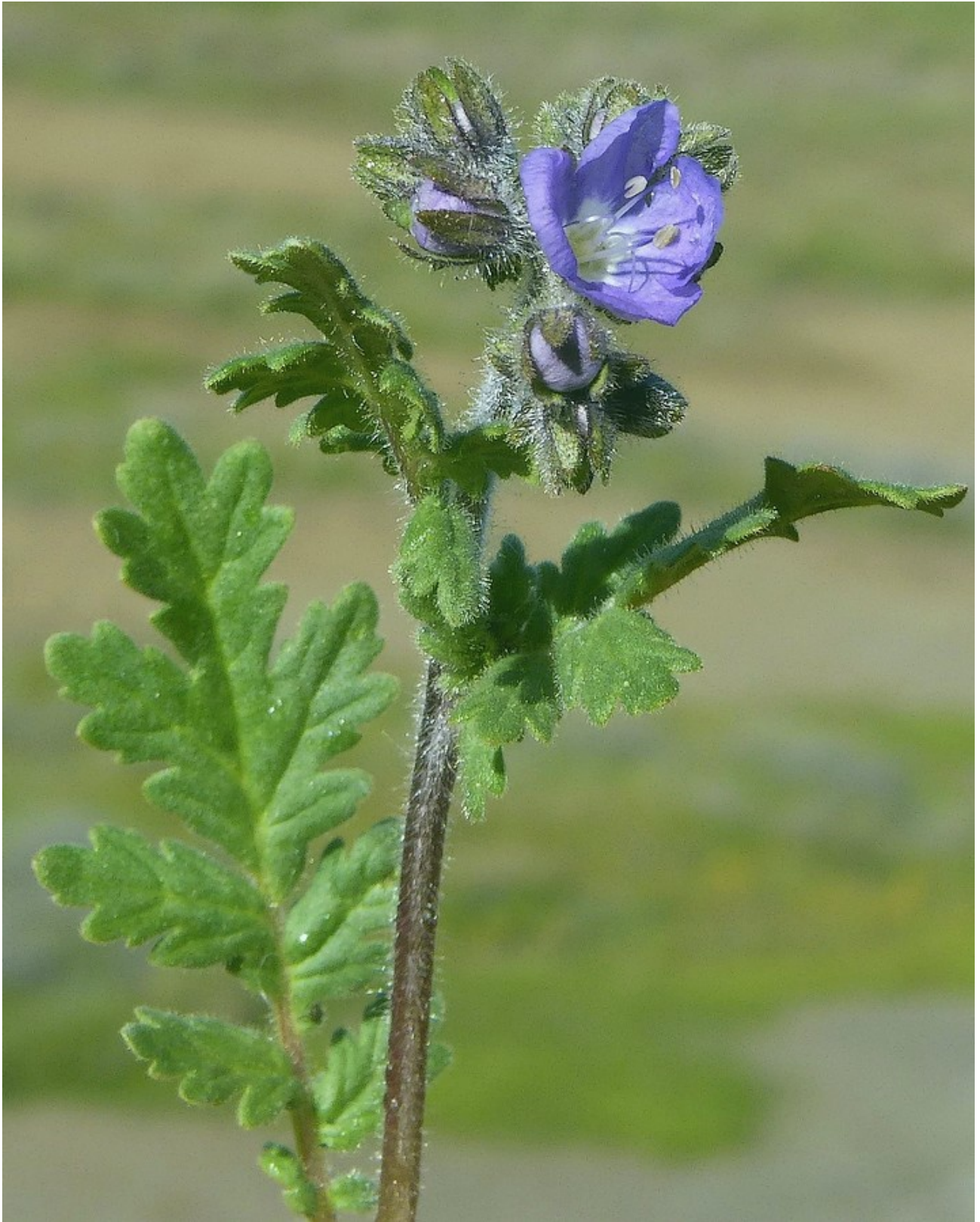
Photo n° 76. Phacelia ciliata Benth. – 30 mars 2024, © D. Gaodefroy