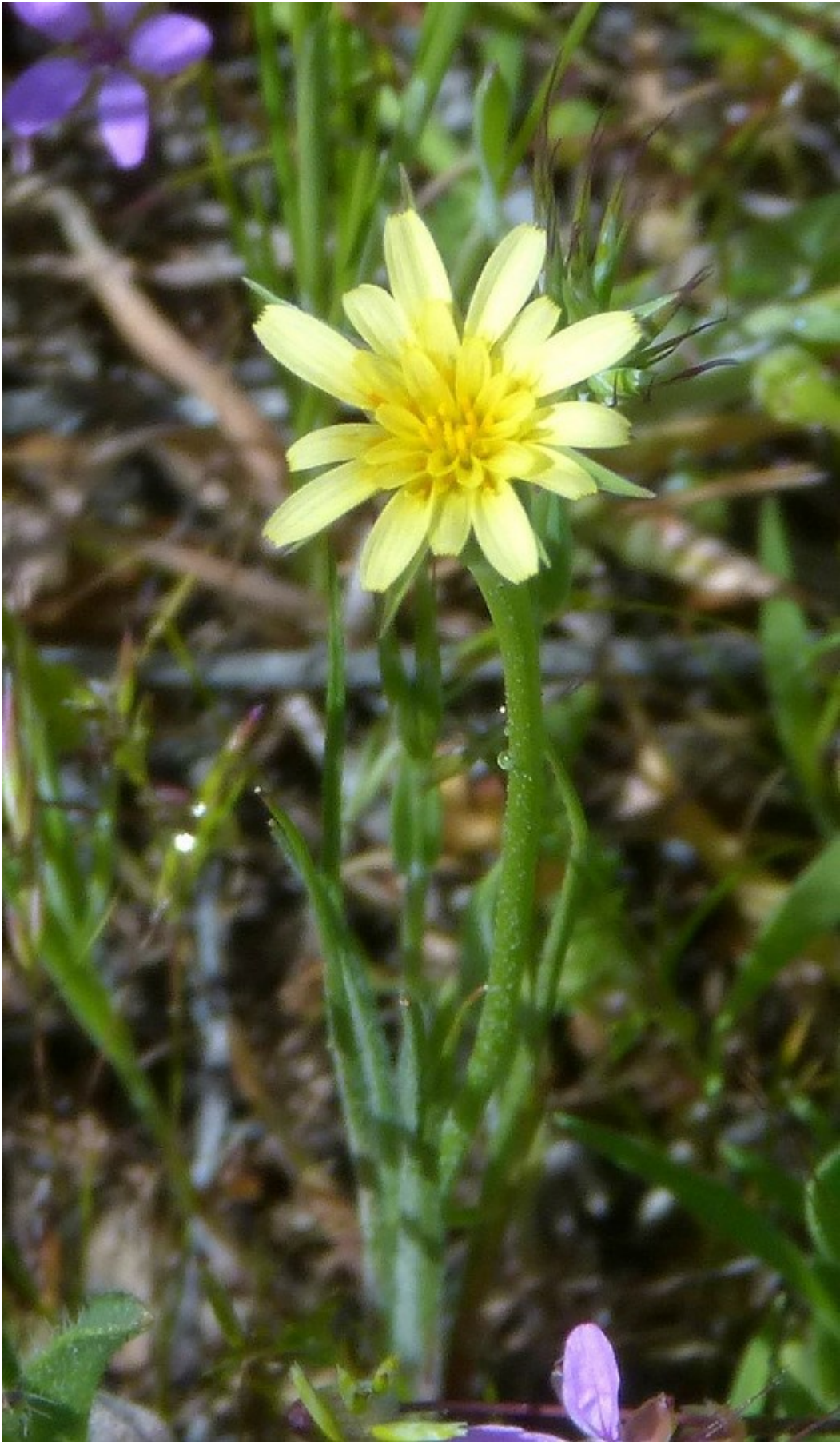
Photo n° 96. Uropappus lindleyi (DC.) Nutt. – 30 mars 2024