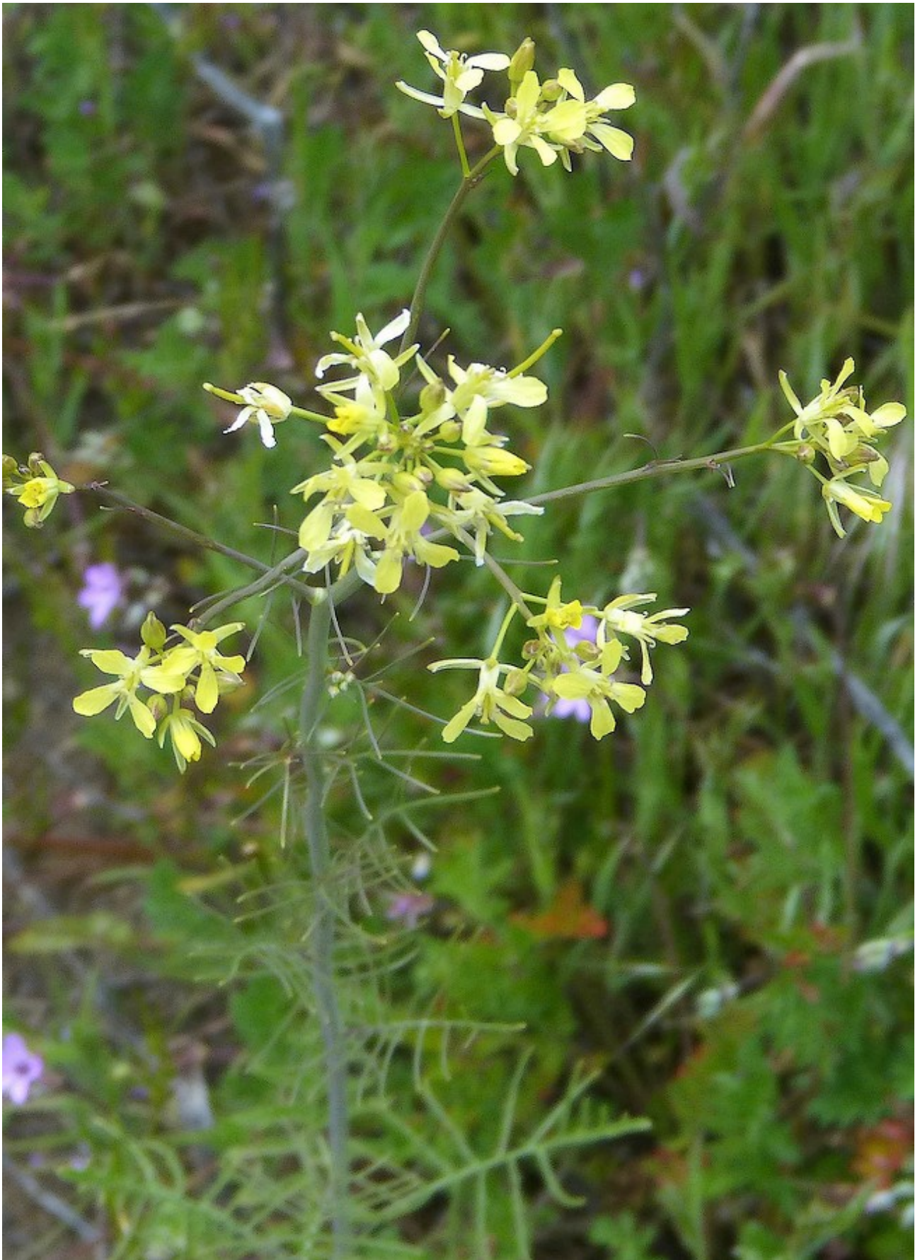
Photo n° 84. Sisymbrium altissimum L. – 30 mars 2024