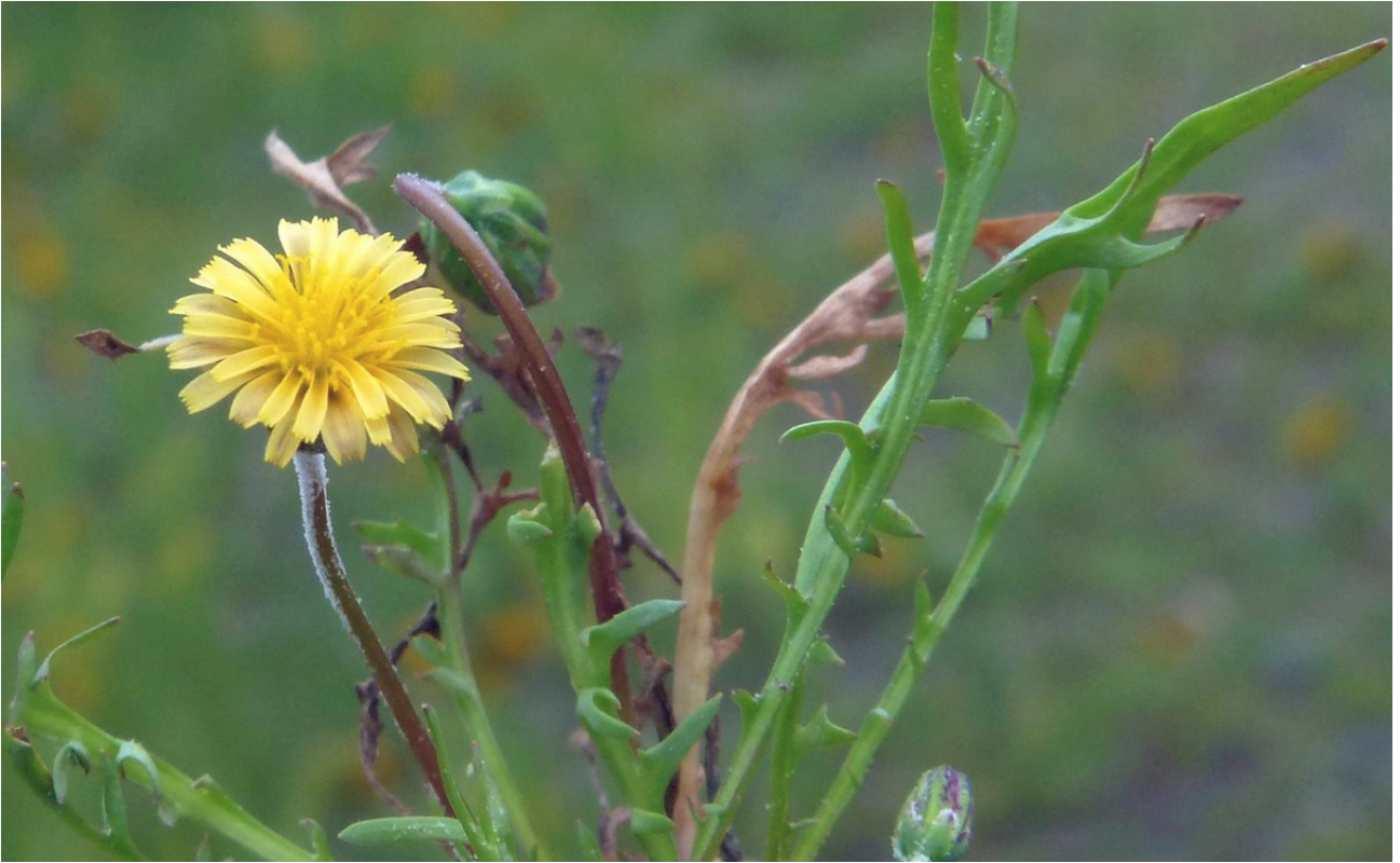
Photo n° 70. Microseris douglasii (DC.) Sch. Bip. – 30 mars 2024