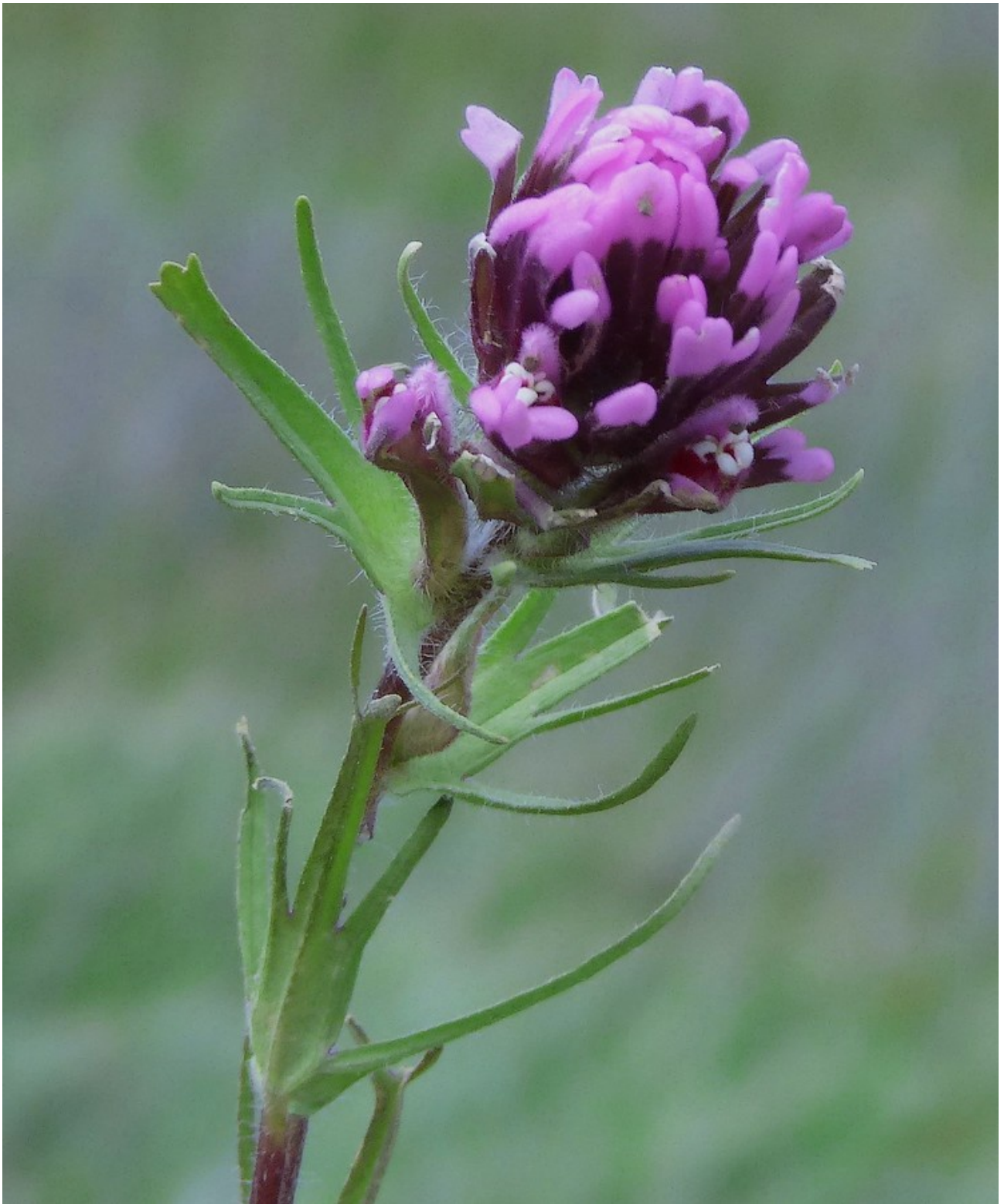
Photo n° 30. Castilleja exserta (A. Heller) T. I. Chuang & Heckard ssp. exserta – 30 mars 2024