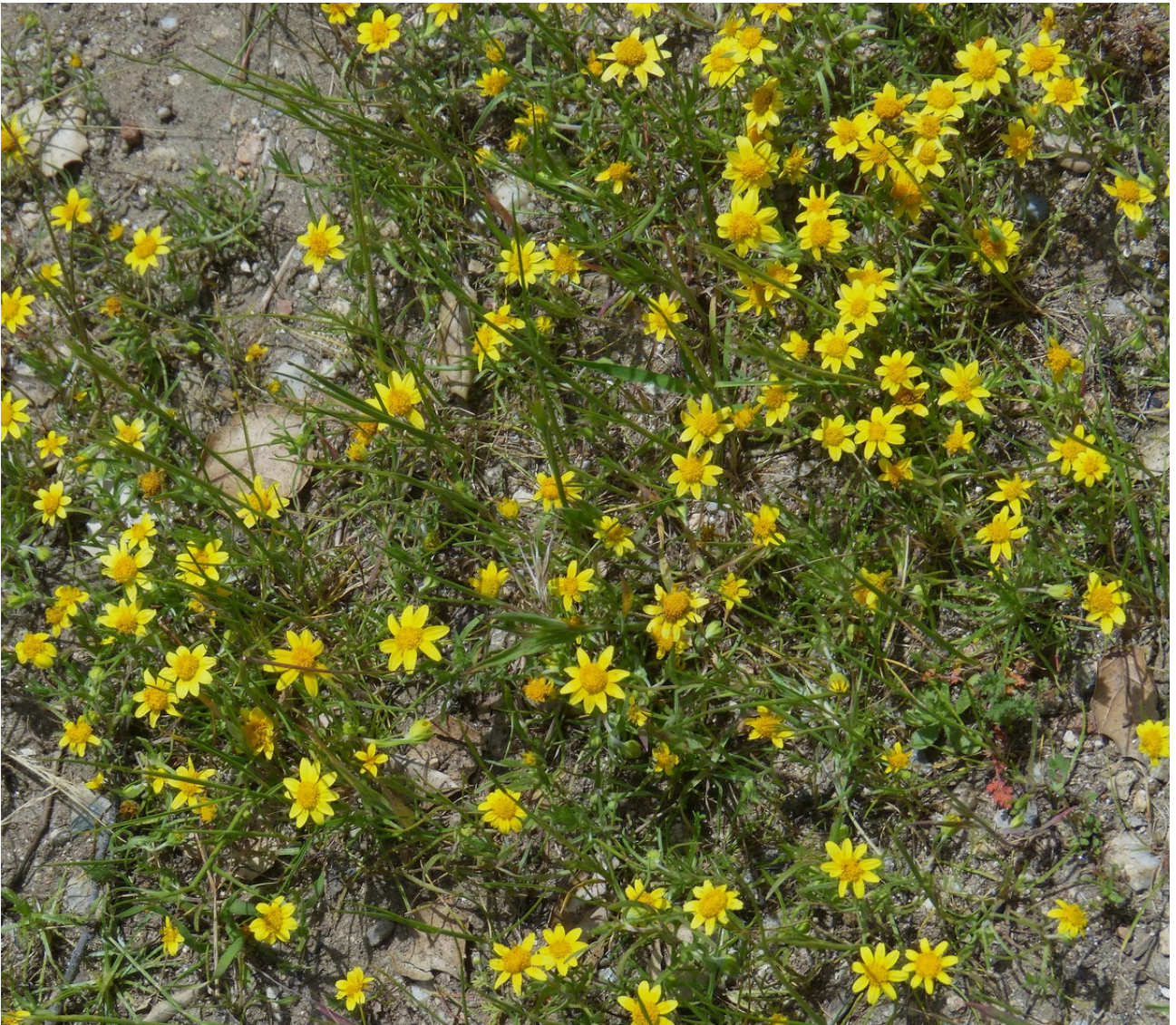
Photo n° 50. Lasthenia californica DC. ex Lindl. – 30 mars 2024

Photo n° xx. Lasthenia minor (DC.) Ornduffs – Pas de photo DG