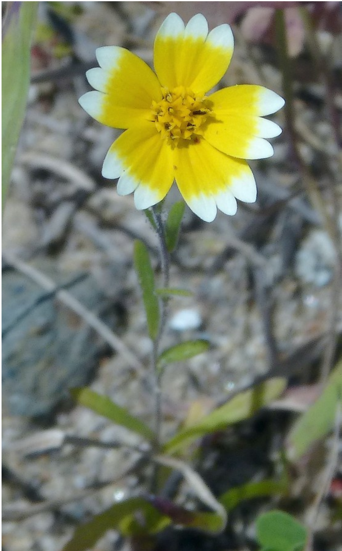
Photo n° 56. Layia munzii D. D. Keck – 30 mars 2024