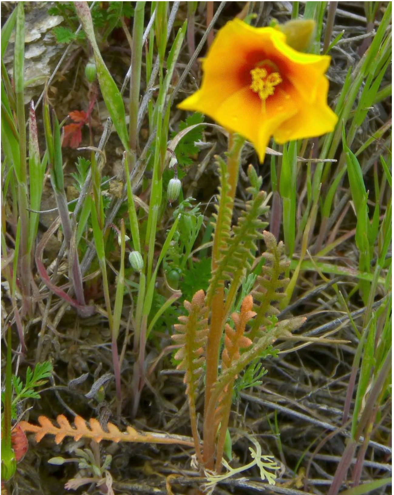
Photo n° 68. Mentzelia pectinata Kellogg - 30 mars 2024, © D. Gaudefroy